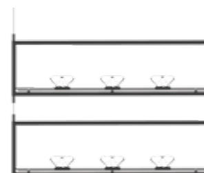
Arrangement une sur l'autre Arrangement on top of each other

LL-S A élément de présentation suspendu: cadre support en acier époxy noir (blanc sur demande) disponible en 2 tailles, avec 2 filins en acier inoxydable (2 m de long chaque). Tablette en verre clair ou en dérivé de bois peint, disponible dans divers décors. Avec panneau poster en option.