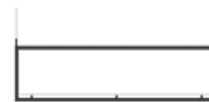
06 LL-S 12 A