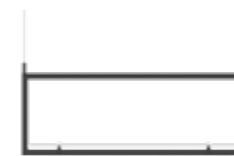
05 LL-S 9 A