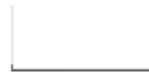
08 LL-S 12 H